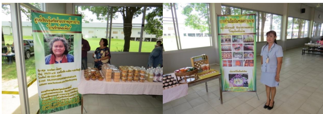
กิจกรรมส่งเสริมการเห็นคุณค่าของผู้ปฏิบัติงานและรอบครัว “ตลาดนัดชุมชน”

นอกจากนี้ บริษัทฯ ริเริ่มโครงการส่งเสริมการสร้างรายได้และเศรษฐกิจแบบพึ่งพาพระหัตถ์ซึ่งแรงงานกับผู้ประกอบการค้าในชุมชนเพื่อการยังชีพรายย่อย โดยจัดให้มีตลาดนัดขึ้นภายในโรงงานทุกวันเงินเดือนออก โดยพนักงานจะได้ซื้อสินค้าอุปโภค บริโภคที่มีคุณภาพและราคาถูกกว่าท้องตลาด