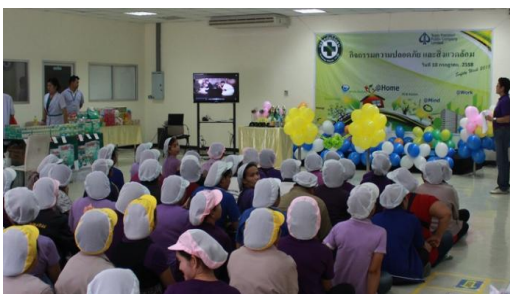
จัดงานสัปดาห์ตระหนักรู้ ความปลอดภัยในการทำงาน