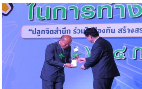
รางวัลสถานประกอบการดีเด่นติดต่อกันเป็นปีที่ 6 ประจำปี 2558

จากการที่เราได้สมัครระดับองค์กรให้เป็นองค์กรที่สามารถจัดการด้านความปลอดภัย สุขภาพและสิ่งแวดล้อมใน สถานที่ทำงานโดยสอดคล้องกับข้อกำหนดและมาตรฐานสากลอย่างต่อเนื่องมาโดยตลอด และในปี 2558 ส่งผลให้ได้รับรางวัล สถานประกอบการดีเด่นด้านความปลอดภัย และสภาพแวดล้อมในการทำงาน ระดับประเทศ และโล่ประกาศเกียรติคุณการรณรงค์ ลดอุบัติเหตุให้เป็นศูนย์