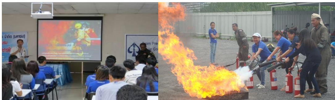
การฝึกอบรมดับเพลิงขั้นต้นและการฝึกซ้อมดับเพลิง