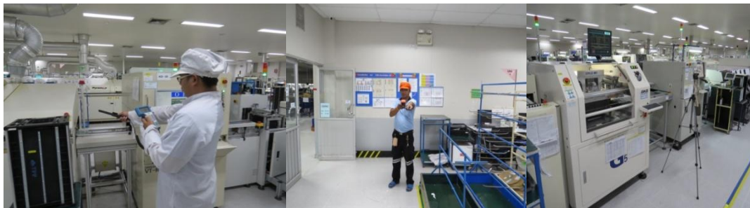
การตรวจวิเคราะห์คุณภาพด้านสิ่งแวดล้อม