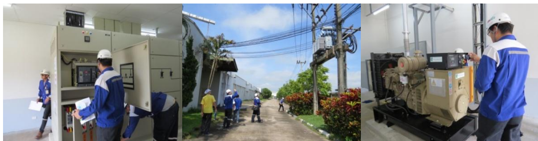
การตรวจสอบอาคารและระบบไฟฟ้าประจำปี