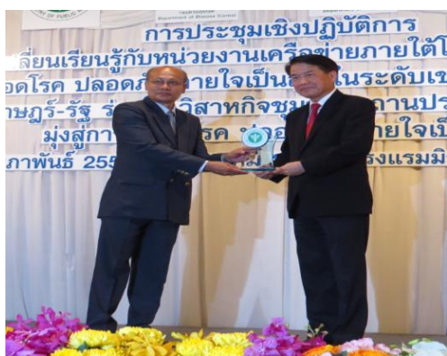
สถานประกอบการปลอดโรค ปลอดภัย ใจเป็นสุข ระดับประเทศ