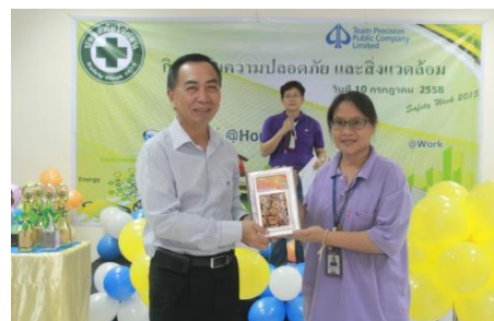
จัดนิทรรศการปลอดภัยและสิ่งแวดล้อมในการทำงาน