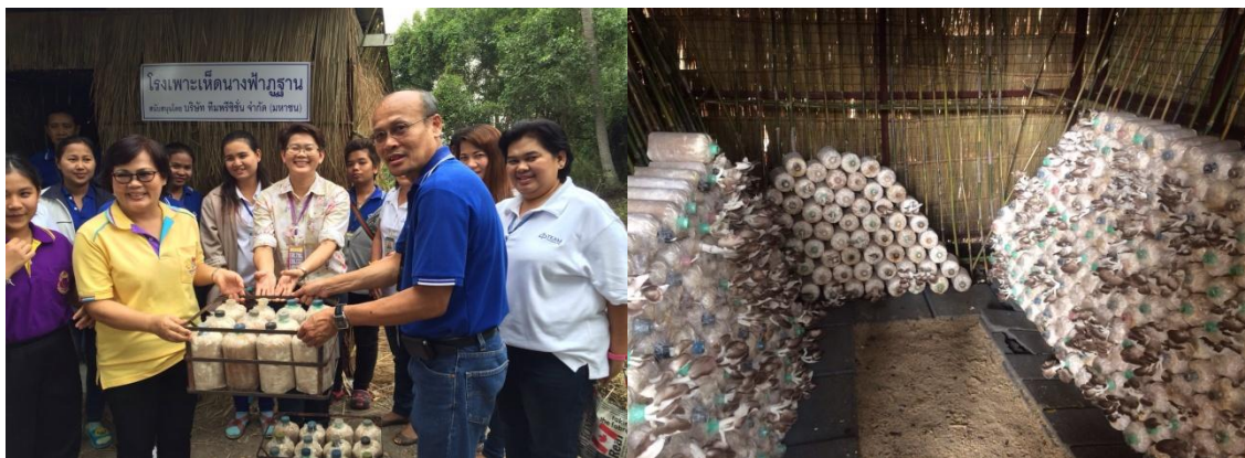
มอบ โรงเพาะเห็ดพร้อมเชื้อเห็ดภูฐาน เพื่อการศึกษาและพัฒนาส่งเสริมอาชีพให้นักเรียน

นอกจากนี้ บริษัทฯ ริเริ่มโครงการส่งเสริมการสร้างรายได้และเศรษฐกิจแบบพึ่งพาพระหัตถ์ซึ่งแรงงานกับผู้ประกอบการค้าในชุมชนเพื่อการยังชีพรายย่อย โดยจัดให้มีตลาดนัดขึ้นภายในโรงงานทุกวันเงินเดือนออก โดยพนักงานจะได้ซื้อสินค้าอุปโภค บริโภคที่มีคุณภาพและราคาถูกกว่าท้องตลาด