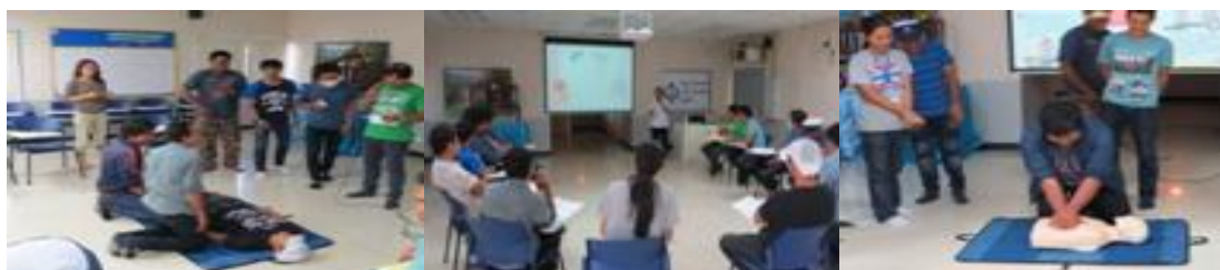
การจัดฝึกอบรมปฐมพยาบาลและปฏิบัติการช่วยชีวิตขั้นพื้นฐาน

บริษัทฯ ยังให้ความสำคัญกับการให้ความรู้กับพนักงานตามความจำเป็นที่พนักงานต้องได้รับการอบรมให้เกิดความเข้าใจ สามารถปฏิบัติและให้ความร่วมมือได้อย่างถูกต้องเมื่อเกิดเหตุฉุกเฉินขึ้น เพื่อหลีกเลี่ยงอันตรายและการสูญเสีย บาดเจ็บ