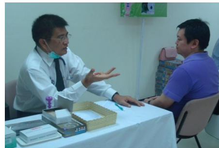
มีแพทย์ให้บริการปรึกษาเรื่องสุขภาพ