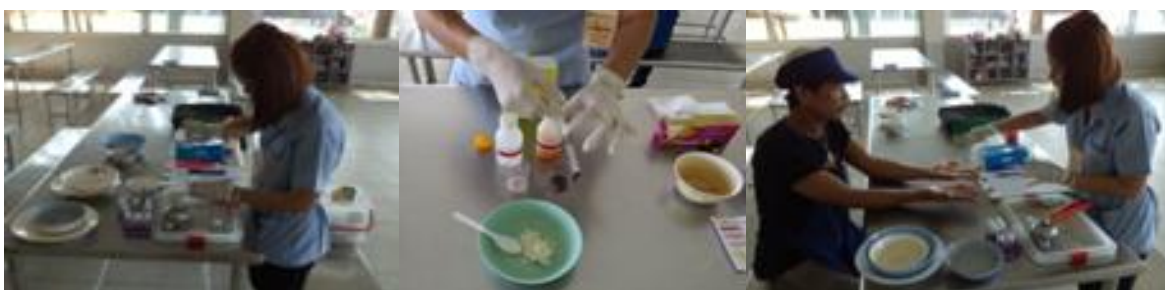
การสุ่มตรวจสอบปนเปื้อนในวัตถุดิบที่นำมาปรุงอาหารของผู้ประกอบการร้านค้า

ด้านการร้องเรียน เปิดโอกาสให้มีการร้องเรียนของพนักงานต่อบริษัทฯ ในเรื่องที่ไม่ได้รับความเป็นธรรม มีการปฏิบัติที่ไม่ถูกต้อง หรือมีการละเลยไม่ปฏิบัติตามข้อบังคับการทำงานหรือสัญญาหรือข้อตกลงที่ร่วมกันจัดทำไว้ โดยมีการกำหนดเป็นแนวทางให้ผู้ร้องทุกข์ได้ปฏิบัติตามขั้นตอน หรือกระบวนการร้องทุกข์ที่บริษัทฯ กำหนดไว้ในข้อบังคับเกี่ยวกับการทำงานของบริษัทฯ