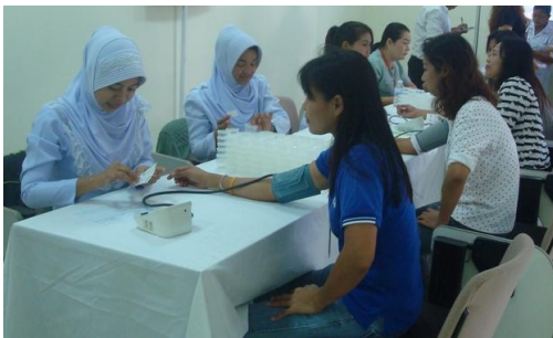
การตรวจสอบสุขภาพของพนักงานต่อเนื่องทุกปี

ด้านสวัสดิการ การรักษาพยาบาลและความปลอดภัย ถือเป็นความรับผิดชอบของบริษัทฯ ที่จะต้องดูแลสวัสดิภาพของพนักงาน และรักษาสภาพการทำงานให้เป็นไปโดยถูกต้อง ปลอดภัย และถูกสุขลักษณะ และยึดมั่นในการปฏิบัติตามกฎหมายที่เกี่ยวข้องกับแรงงานอย่างเคร่งครัด พร้อมทั้งคำนึงถึงสวัสดิภาพที่ดีของพนักงานเป็นสำคัญ