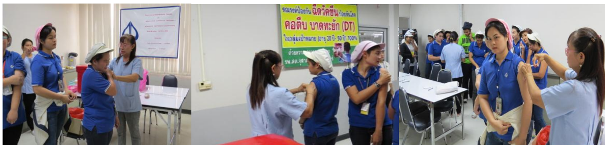
การณรงค์คัดวัดคลื่นป้องกันโรคคอติบ ภาวะตะยัก เกล็ดพระเกียรติสมเด็จพระเทพรัตนราชสุดาฯ สยามบรมราชกุมารี