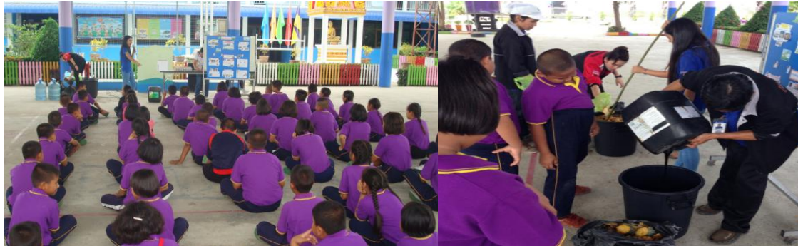
การเผยแพร่ความรู้เรื่องการทำน้ำหมักชีวภาพเพื่อการเกษตรอินทรีย์ และการดูแลสิ่งแวดล้อม

เป็นโครงการและกิจกรรมส่งเสริมให้โรงเรียนในชุมชนใกล้เคียง และนักเรียนได้ปลูกผักและเลี้ยงไก่ เลี้ยงปลา เพื่อเป็นการช่วยเหลืออาหารกลางวันแก่นักเรียน และเป็นการส่งเสริมการประกอบอาชีพในหลักสูตรการศึกษา วัตถุประสงค์ลดขยะ