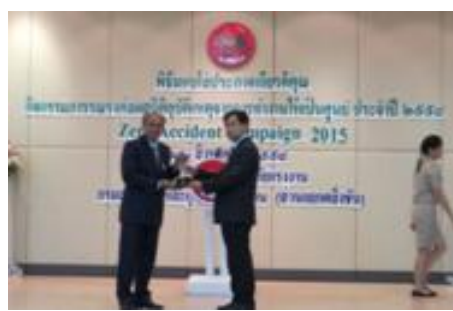
โครงการรณรงค์ลดสถิติการประสบอันตราย ประจำปี 2558 การทำงานให้เป็นศูนย์